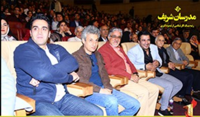
جشن تقدیر از رتبه‌های یک و تک رقومی موسسه مدرسان شریف در آزمون کارشناسی ارشد و دکتری ۹۶ - سوم آذرماه سال ۹۶ - برج میلاد- تهران /Modaresanesharif.ac @Modaresanesharif_channel