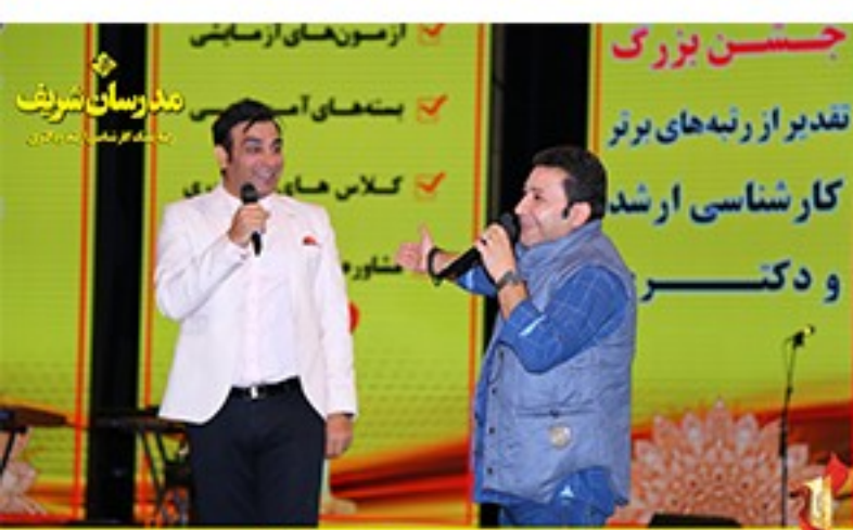
/Modaresanesharif.ac / @Modaresanesharif_channel / جشن تقدیر از رتبه‌های یک و تک رقمی موسسه مدرسان شریف در آزمون کارشناسی ارشد و دکتری ۹۶ - سوم آذرماه سال ۹۶ - برج میلاد- تهران