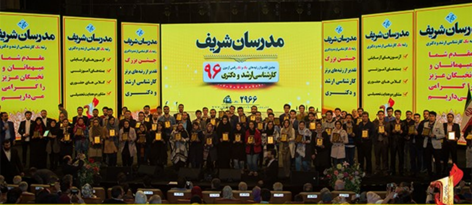
/Modaresanesharif.ac / @Modaresanesharif_channel / جشن تقدیر از رتبه‌های یک و تک رقمی موسسه مدرسان شریف در آزمون کارشناسی ارشد و دکتری ۹۶ - سوم آذرماه سال ۹۶ - برج میلاد- تهران