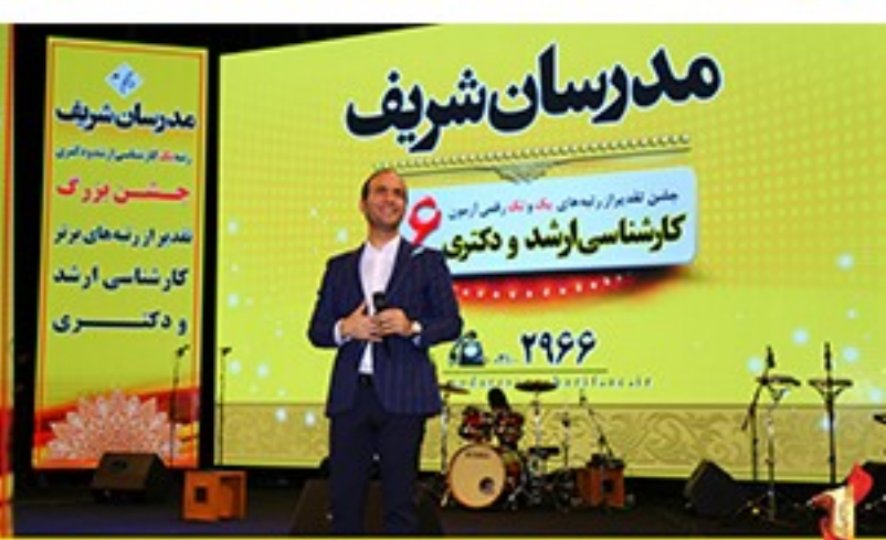
/Modaresanesharif.ac / @Modaresanesharif_channel / جشن تقدیر از رتبه‌های یک و تک رقمی موسسه مدرسان شریف در آزمون کارشناسی ارشد و دکتری ۹۶ - سوم آذرماه سال ۹۶ - برج میلاد- تهران