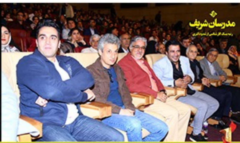
/Modaresanesharif.ac / @Modaresanesharif_channel / جشن تقدیر از رتبه‌های یک و تک رقمی موسسه مدرسان شریف در آزمون کارشناسی ارشد و دکتری ۹۶ - سوم آذرماه سال ۹۶ - برج میلاد- تهران