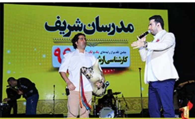
/Modaresanesharif.ac / @Modaresanesharif_channel / جشن تقدیر از رتبه‌های یک و تک رقمی موسسه مدرسان شریف در آزمون کارشناسی ارشد و دکتری ۹۶ - سوم آذرماه سال ۹۶ - برج میلاد- تهران