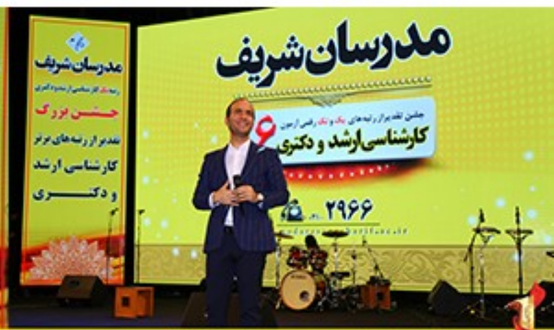
/Modaresanesharif.ac / @Modaresanesharif_channel / جشن تقدیر از رتبه‌های یک و تک رقمی موسسه مدرسان شریف در آزمون کارشناسی ارشد و دکتری ۹۶ - سوم آذرماه سال ۹۶ - برج میلاد- تهران