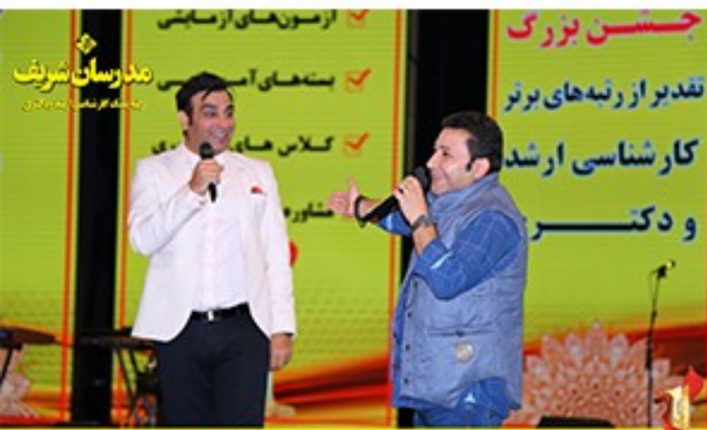
/Modaresanesharif.ac / @Modaresanesharif_channel / جشن تقدیر از رتبه‌های یک و تک رقمی موسسه مدرسان شریف در آزمون کارشناسی ارشد و دکتری ۹۶ - سوم آذرماه سال ۹۶ - برج میلاد- تهران