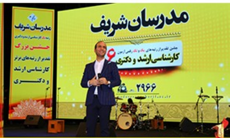
جشن تقدیر از رتبه‌های یک و تک رقومی موسسه مدرسان شریف در آزمون کارشناسی ارشد و دکتری ۹۶ - سوم آذرماه سال ۹۶ - برج میلاد- تهران

/Modaresanesharif.ac @Modaresanesharif_channel